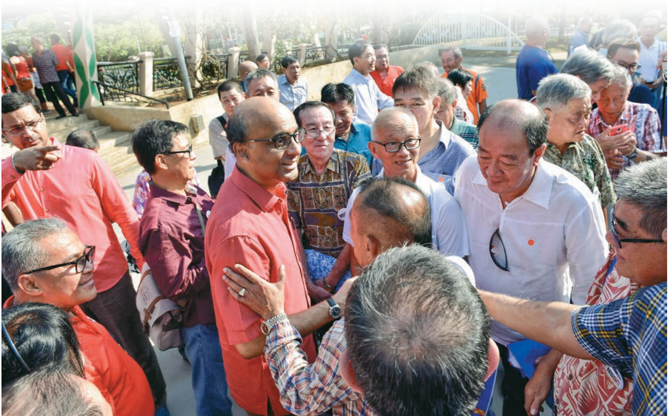
SM Tharman with the first batch of NSmen, who were enlisted in Aug 1967 at the old Taman Jurong Camp, commemorating their 50 th anniversary.