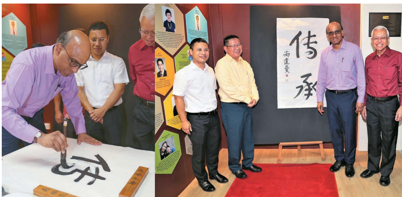
SM Tharman's calligraphy “传承”, presented to Rulang Primary School on its 90 th Anniversary. 尚达曼国务资政的亲笔书法作品“传承”，赠予儒廊小学庆祝它建校90周年。